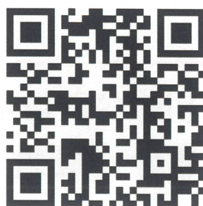
GB 11417.3—2012 标准复审调研问卷